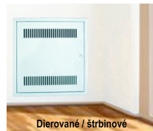
Dierované / štrbinové